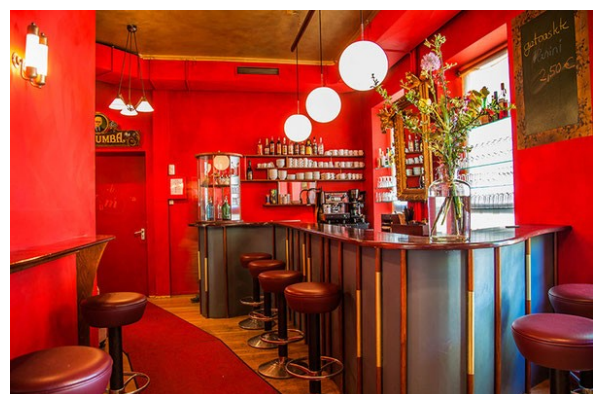
Foyer / Bar

Weitere Bilder finden Sie auf unserer Webseite.